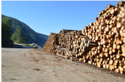
Bilde 1: Tømmerkaia i Feios i August 2016.

Dette heftet er ment til å være en oversikt over de fleste aktørane innanfor skognæringen i fylket, til hjelp og informasjon om den som måtte trenge dette i tilknytt skogbruk eller anna formål.