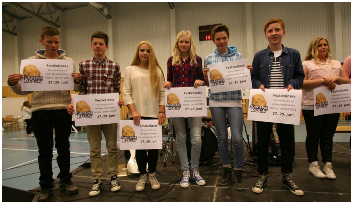
Elevbedrifta i «Full fyr» ved Flatbygdi skule i Vik, vann i kategorien miljø og berekraft.

Lærdal var vertskap for entreprenørskapsmessa for alle ungdomsskulane i Sogn 7. mai. Vi er truleg den einaste regionen i landet som arrangerer slike interkommunale messer på ungdomsskuletrinnet. Leiinga i Ungt Entreprenørskap i Noreg var gjest på messa i Lærdal, saman med dei ni ordførarane. Tradisjonen tru vart det regionale fagnettverket i entreprenørskap arrangert i september, i vertskommunen. Programleiar har også denne hausten to dagar med undervisning for 2. klasse ved Sogndal vidaregåande skule i programmet til Ungt Entreprenørskap "Frå utdanning til jobb".