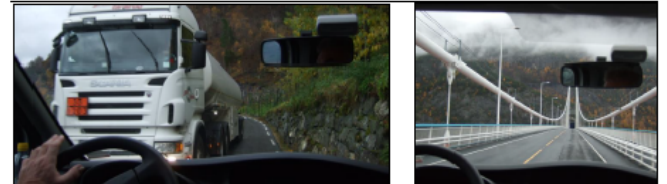
Bilde: Vid spennande trafikksituasjonar undervegs, her langs Hardangerfjorden. Under: Ei nying å krysse over Hardangerbrua.