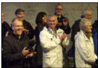
Styret i IS Fjordvegen Rute 13 på ringing

Nettsida www.fjordvegen.no skal nyttast til fakta om kva selskapet sjølv er og gjer, verra oppslagsplass og arena medlemmene med deira interesse. Ny versjon der litt arbeid gjenstår ligg ute no, ta ein bitt og gje oss gjerne kommentarar.