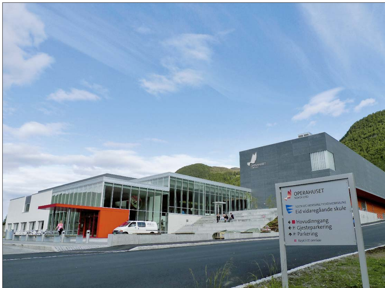
OPERAHUSET på Nordfjordeid vert varma opp med fjordvarme gjennom ei sosial bedrift.

ER eit relativt nytt omgrep, sjølv om bruken av det kan førast tilbake til 1970-talet. Ein sosial entreprenør er ein person, organisasjon eller eit nettverk som startar ei ny bedrift for å tene pengar og for å løyse eit samfunnsproblem. «Sosiale bedrifter» har altså både økonomiske og sosiale føremål. Døme