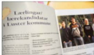
VIKTIG: Lærlingane er vilt ut etter i Årsrapporten 2017 for Luster kommune. Å tilby lærlingeplassar vart trekt fram som ein god måte å rekruttere på.